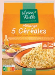
MÉLANGE 5 CÉRÉALES 2,5kg

Des recettes originales, saines et simples à cuisiner pour varier vos menus