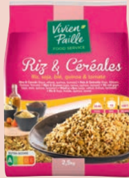
RIZ & CÉRÉALES 2,5kg