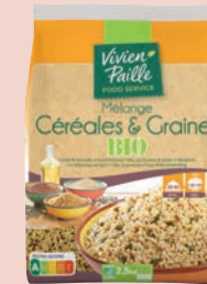
MÉLANGE CÉRÉALES & GRAINES BIO 2,5kg